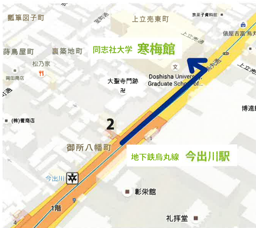
←寒梅館までの主要交通機関