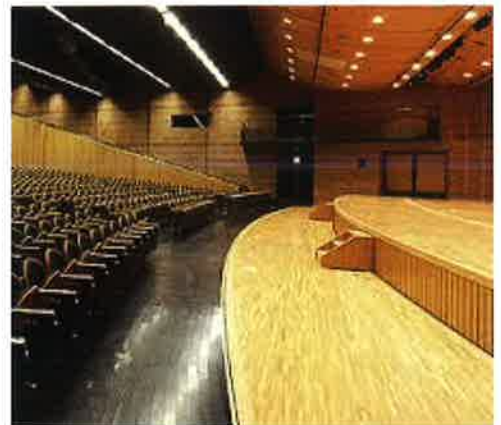
↑寒梅館ハーディーホール 寒梅館 B1F,1F