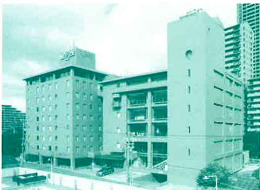
大阪リバーサイドホテル6F 大阪市都島区中野町5丁目12-30 ☎06-6928-3251