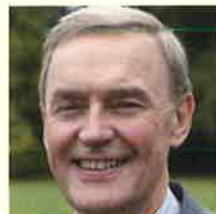
スティーブ・ブレディ