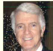
アル・ウィットティングヒル