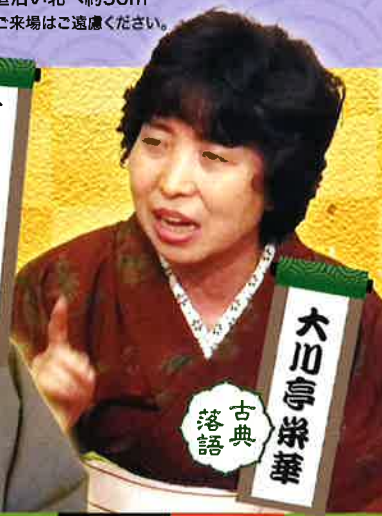
大川亭栄華 古典 落語