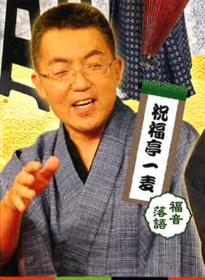
祝福亭一麦 福音 落語