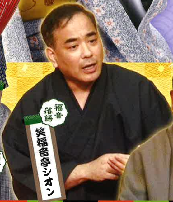
福音 落語 笑福音亭シオン