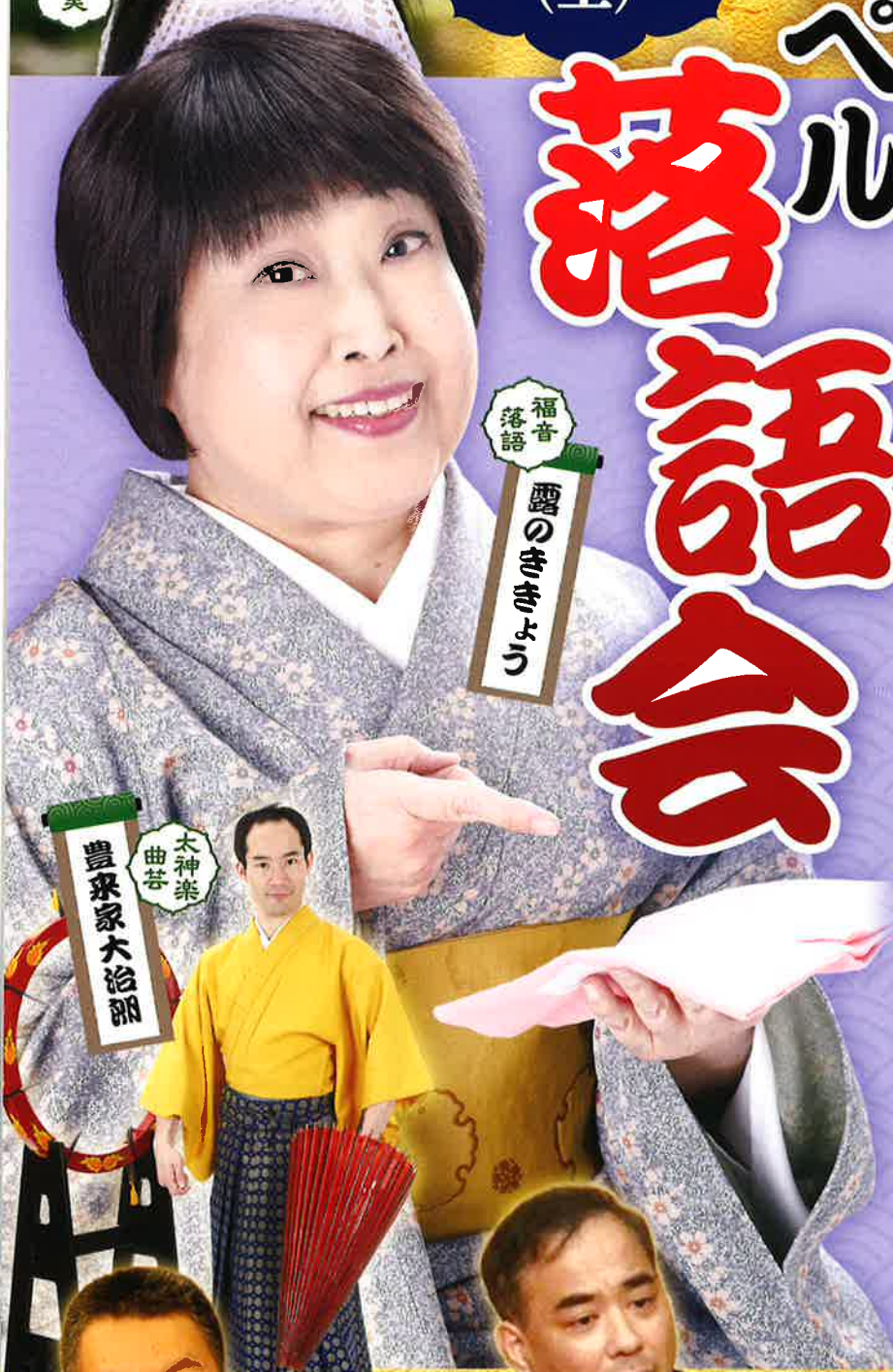
福音 落語 露のききよう