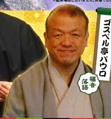
ゴスペル亭パウロ 福音 落語